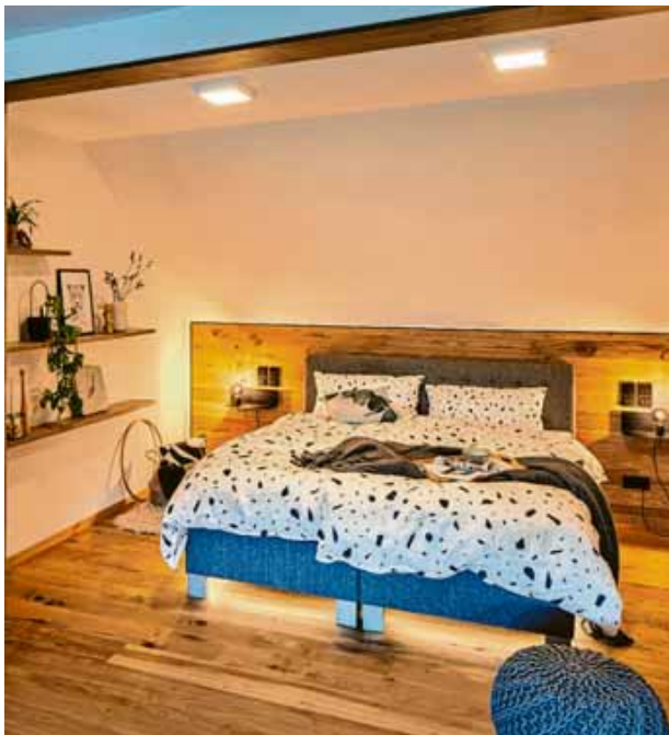
Die Kombination verschiedener Lichtquellen schafft eine behagliche Stimmung im Schlafzimmer.

Zusätzlich zur Basisbeleuchtung sind verschiedene Lichtzonen im Schlaf-