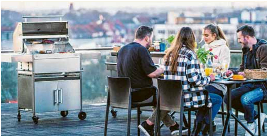
Grillen und Genießen über den Dächern der Stadt: Mit stabilen Beistelltischen aus Edelstahl hat man hier ganz andere Möglichkeiten.

Für das Gelingen jedes Grillevents ist auch das Zubehör entscheidend. Mit