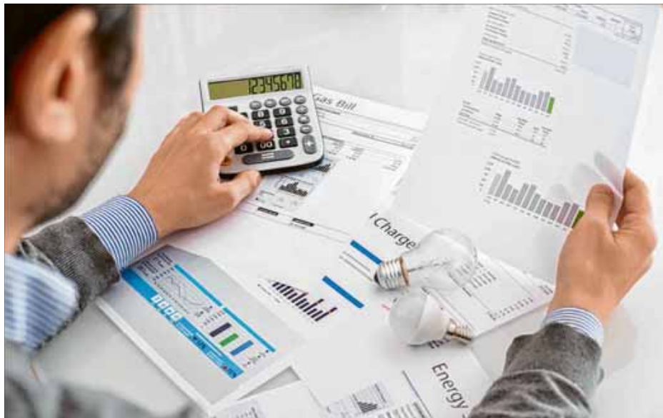
Wer trotz verfügbarem Gas auf Strom zum Heizen umsteigt, zahlt in der Folge nahezu das Dreifache.

Grundsätzlich gut zu wissen: Haushalte gehören zu den gesetzlich geschützten Kunden, die auch dann mit Gas beliefert werden, wenn die Gasversorgung stark eingeschränkt wäre, so die Energieberatung der Verbraucherzentrale. Zudem zeigen Musterrechnungen, dass es auch bei hohen Preisen für die Wärmeversorgung nicht sinnvoll ist, das Zuhause mit Elektroheizungen warm zu halten. Ein Haushalt verbraucht pro Jahr zwischen 2000 und 3500 Kilowattstunden. Dazu kommen noch einmal 10 000 – 35 000 Kilowattstunden Wärmeverbrauch. Wer trotz verfügbarem Gas auf Strom zum